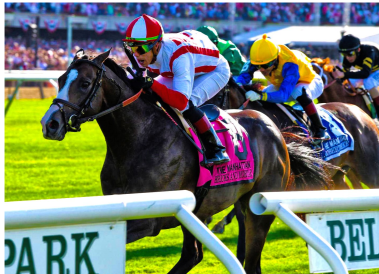
BRICKS AND MORTAR Pegasus World Cup (G1) Breeder's Cup Turf (G1) Arlington Million (G1) Turf Classic S. (G1) Manhattan S. (G1) Muniz Memorial H. (G2) NM of Racing HoF. (G2) USD$ 7.085.650