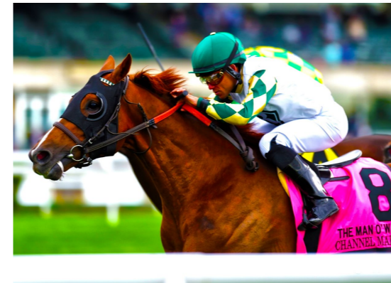
CHANNEL MAKER The Man O' War S. (G1)