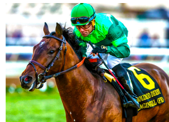
RAGING BULL Hollywood Derby (G1)