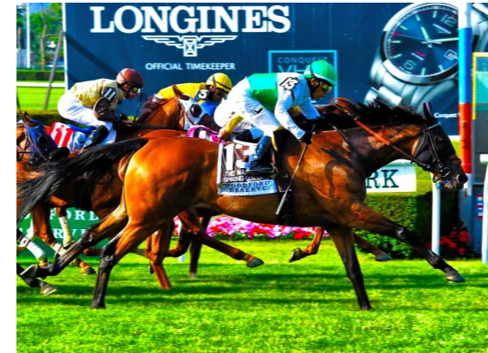
SRING QUALITY Manhattan S. (G1)