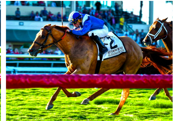
ALMANAAR Gulfstream Park Turf H. (G1)