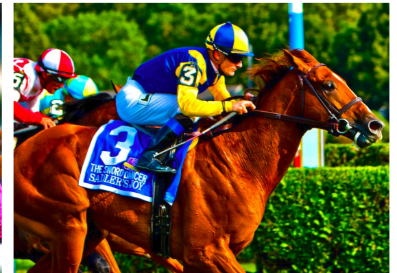
SADLER'S JOY Sword Dancer S. (G1)